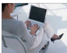
自分で更新できる